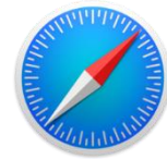
Safari (Apple) ✓

HINWEISE: Der Internet-Explorer von Microsoft ist veraltet und sollte daher nicht verwendet werden! Die Funktionalität oben nicht genannter Web-Browser und veralteter Versionen kann nicht garantiert werden! Bei Problemen mit dem Web-Browser hilft oft dessen Cache bzw. Verlauf zu löschen!